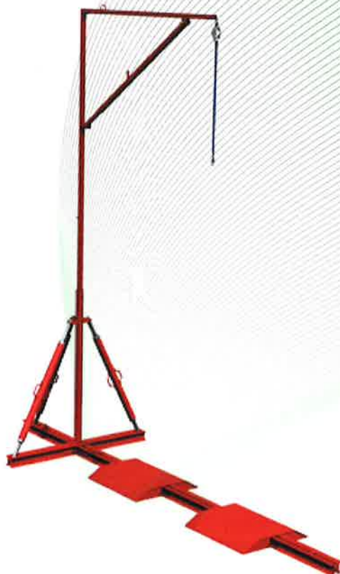
Ilustración 2: Anclaje, tipo: Counterweight MF