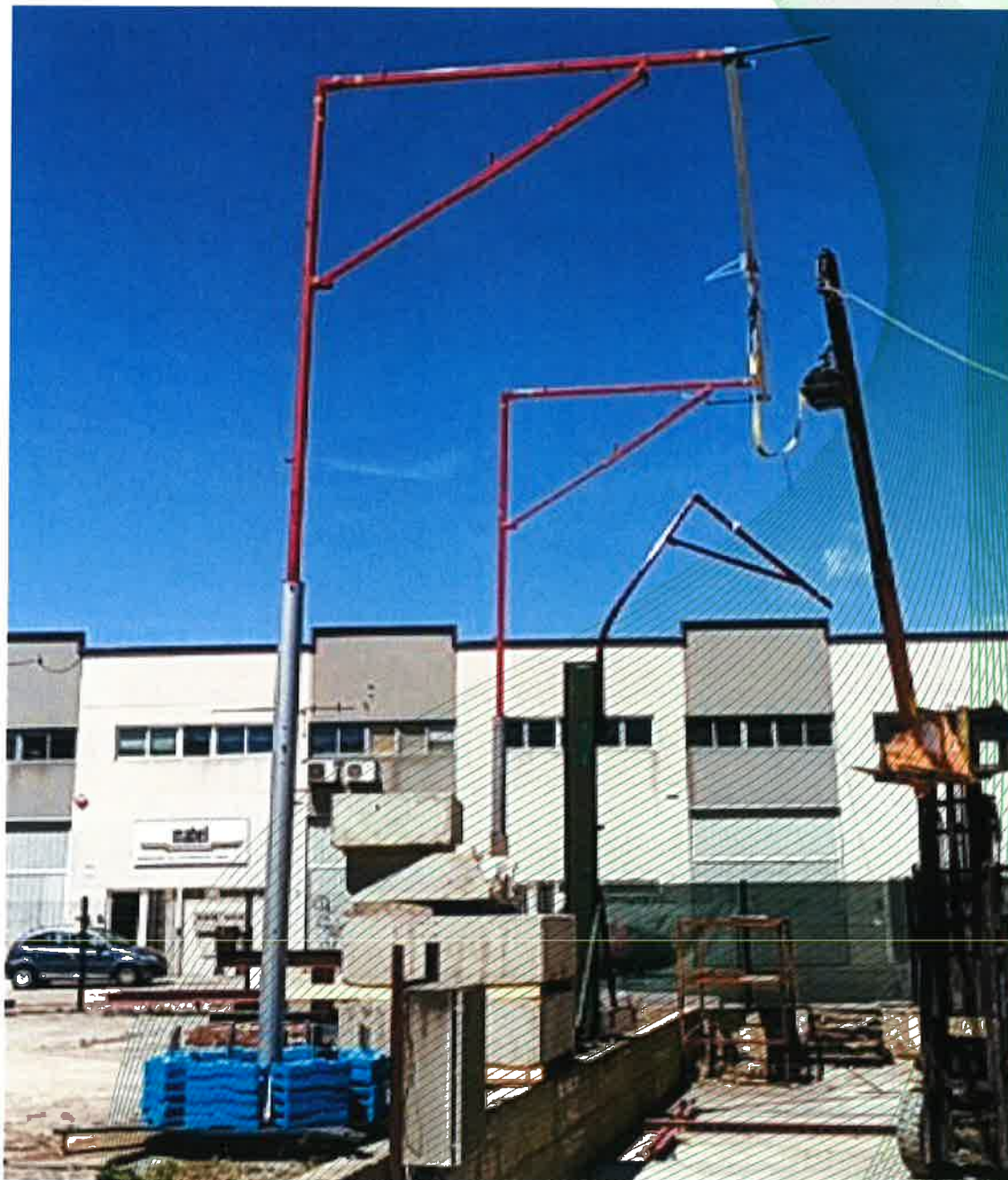
Ilustración 4: Dispositivo de anclaje del tipo D (tipo: Horizontal Safeaccess y NAV2 trolley / fabricante: FALLPROTEC SA) con anclajes, tipo: AlsiPercha y Mobile base units